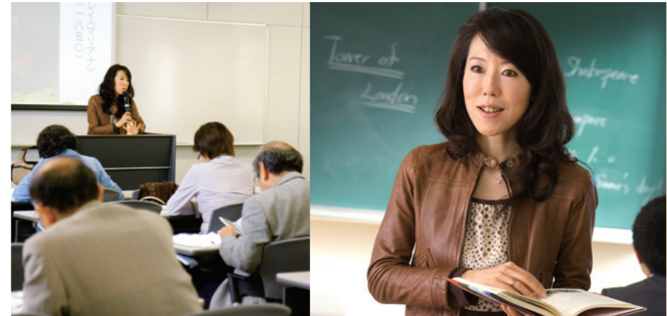
現在、次の著書を執筆中という齊藤先生 授業では語感の美しさ味わってもらうために必ず朗読を行っています